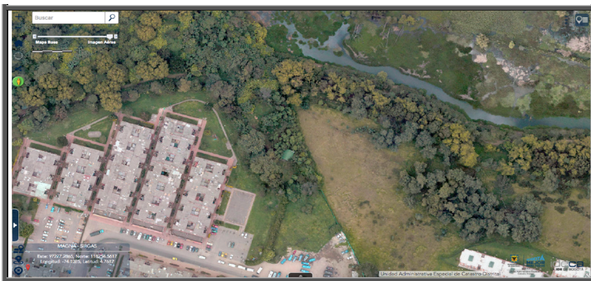
Imagen 2. Vista satelital del área objeto de la tala después de ser intervenida.

Como puede apreciarse en las fotografías satelitales, el área contaba con una significativa extensión de especies arbóreas, las cuales no se encuentran en la actualidad.